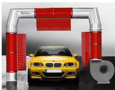
Figura 6. Secadora Windshear fabricada por PROTO-VEST

La secadora Windshear es uno de los sistemas más económicos, y eficientes del mercado Internacional (figura 6). La secadora utiliza un solo Motor de 30 HP MAGNUM, y tres bolsas de alta resistencia que enfocan el aire aerodinámicamente para crear uno de los procesos más eficaces y costo eficientes del mercado. El ventilador está fabricado en acero, y el pleno está hecho de aluminio de aviación. La calidad del secado del sistema Windshear supera el proceso de cualquier secadora en su clase de caballaje. El equipo se puede adaptar un con silenciador y con una compuerta de aire para reducir el consumo de luz entre vehículos.