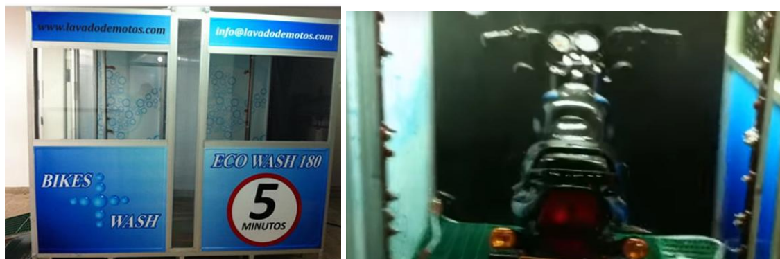
Figura 1. Sistema la ECO WASH 180° fabricado por la empresa Bikes + Wash

Un ejemplo de esto es la empresa Bikes + Wash una empresa Colombiana creada en 2012 con el objetivo de producir máquinas automáticas para el lavado de motocicletas. Sin embargo, ante la creciente demanda de usuarios de motocicletas Bikes + Wash decide lanzarse al mercado con su primera innovación la ECO WASH 180° (Figura 1) y ubicar la maquina en lavaderos de motos propios para darla a conocer a los motociclistas que buscan un servicio excelente, un lavado rápido y de alta calidad. Además, de la venta de este modelo a potenciales clientes que puedan estar interesados en esta línea de máquinas. Es el primer sistema de lavado automático de motos de Colombia en Bogotá. Una maquina novedosa y única en el mercado que facilita el lavado de este tipo de medio de transporte.