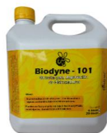
Figura 5. Biodyne® 101 producto importado por Biodyne Bogotá SAS.

Entre sus productos se encuentra el Biodyne® 101(figura 5), el cual está siendo usado en números sistemas de recirculación de aguas de lavaderos con excelentes resultados.