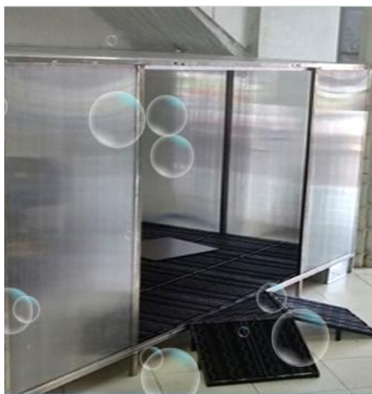
Figura 2. Cabina de lavado fabricada por la empresa Bikes + Wash

Bikes + Wash , también fabrica Innovadoras cabinas para el lavado de motos (Figura 2), fáciles de armar y desarmar no se requiere enchapar paredes ya que contienen la humedad internamente y aptas para ser instaladas en espacio abiertos. Incluyen sistema de sedimentación de lodos, y demás características descritas en la Figura 3.