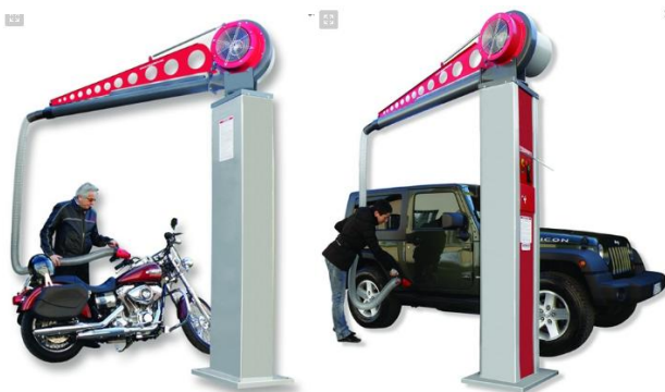
Figura 8. Brazo móvil para secado de vehículos fabricado por EYNA

de la carrocería o dejar restos de pelusilla además de ser más incómodos y lentos a la hora de secar los automóviles.