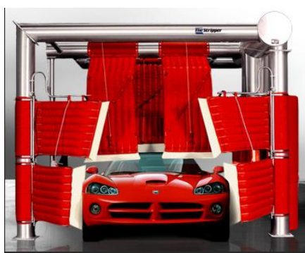
Figura 7. Secadora Stripper fabricada por PROTO-VEST

La secadora Stripper es uno de los sistemas más eficaces y costo eficientes del mercado internacional (figura 6). Utiliza 1 solo motor de 15 HP, y un juego bolsas de alta resistencia que tocan ligeramente los vehículos con rodillos de silicón quirúrgico para brindar un proceso sumamente eficaz. La calidad del secado del sistema IN BAY RM supera a cualquier otra secadora en el mercado. El equipo se puede adaptar con un silenciador y compuerta de aire para reducir aun más el consumo de luz entre vehículos.