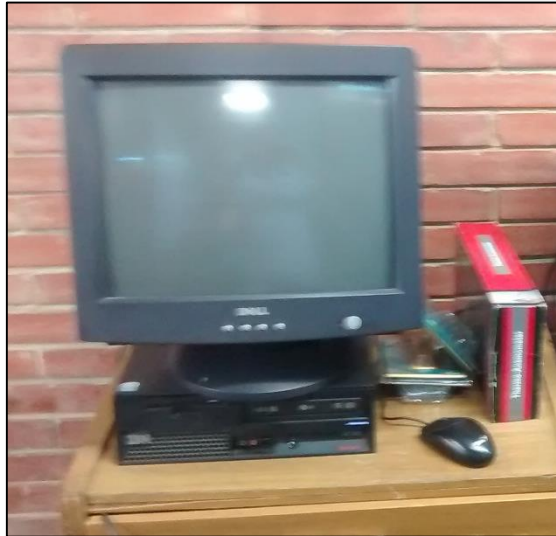
Figura 5. Computador.