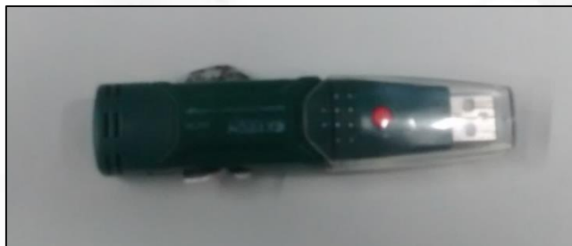
Figura 4. Data-logger.