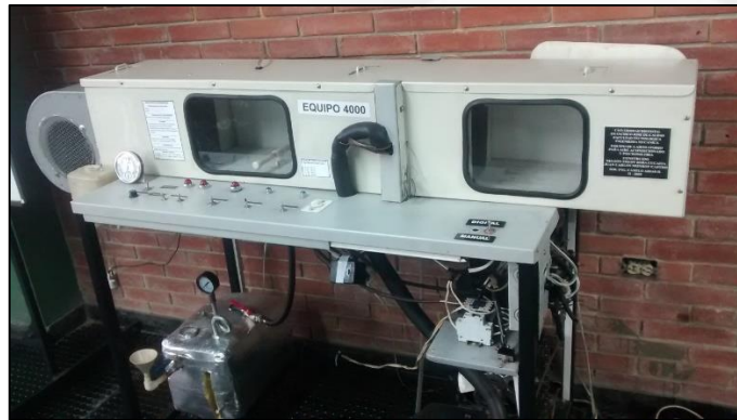
Figura 2. Equipo 4000 (banco de psicrometría).