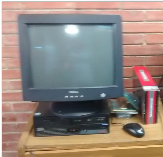
Figura 5. Computador.