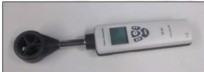
Figura 3. Anemómetro