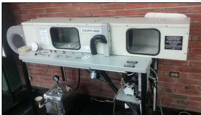
Figura 2. Equipo 4000 (banco de psicrometría).